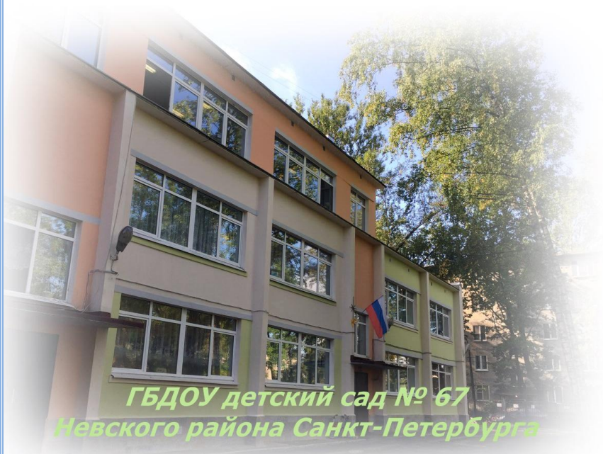
ГБДОУ детский сад № 67 Невского района Санкт-Петербурга